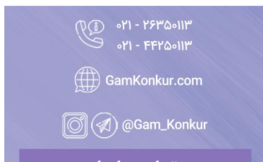
تماس با ما