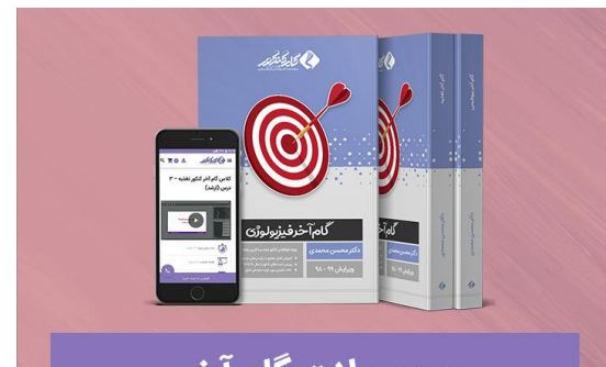
محصولات گام آخر